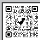
いい顔フォトコン